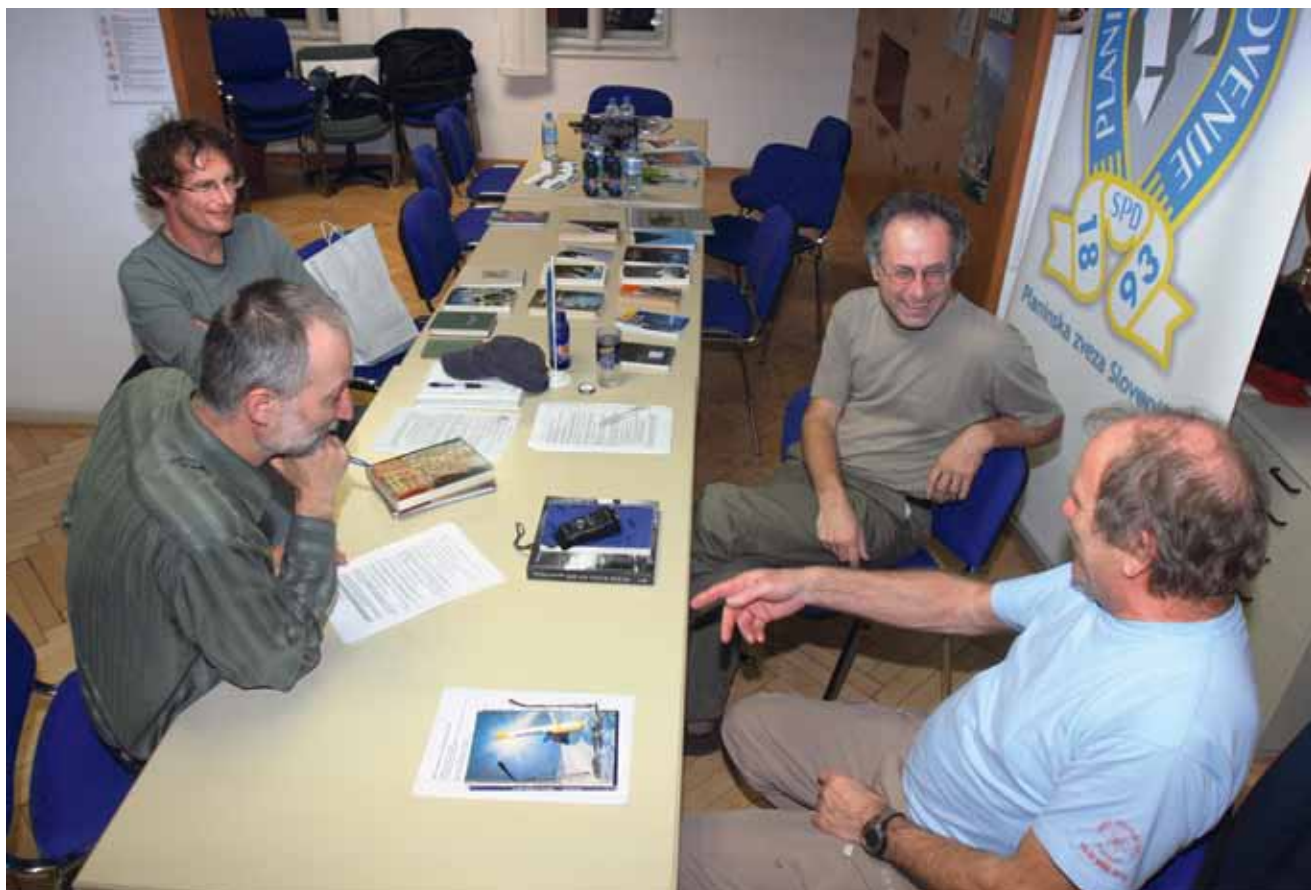
Okrogla miza v prostorih Planinske zveze Slovenije je bila tudi priložnost za izmenjavo mnenj.

Hladnik: Sto slovenskih vrhov je vodnik, resda literariziran, vendar še vedno v prvi vrsti vodnik, čeprav ga lahko