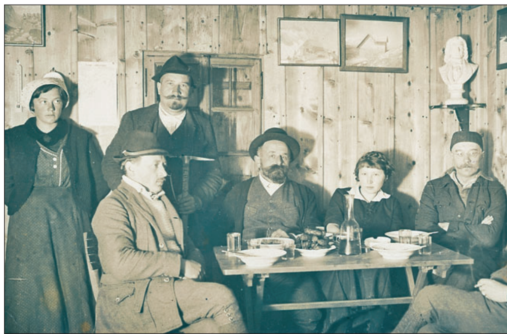
V Prešernovi koči na Stolu (razglednica natisnjena 1928)