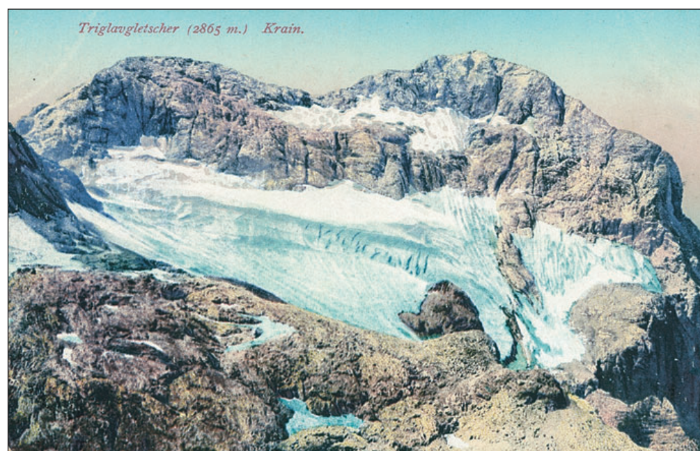
Triglavski ledenik na razglednici, natisnjeni 1912; razlika v količini ledu je očitna.