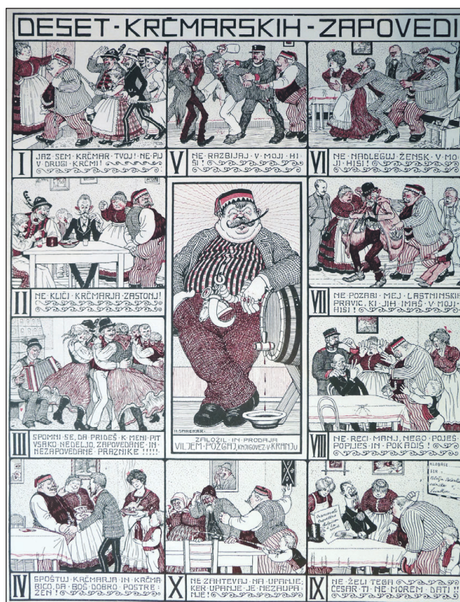
Deset krčmarskih zapovedi

"Sploh pa bodi povedano jasno in glasno, da je roman Prokleta vzbudil tudi v Francozih in Nemcih veliko senzacijo. Kupi si slovenski prevod vsak, ki si želiš mikalnega berila! Kupi si odlični roman posebno Ti, mladenič, ki želiš osrečiti svojo izvoljenko, roman je pripraven za vsako darilo."