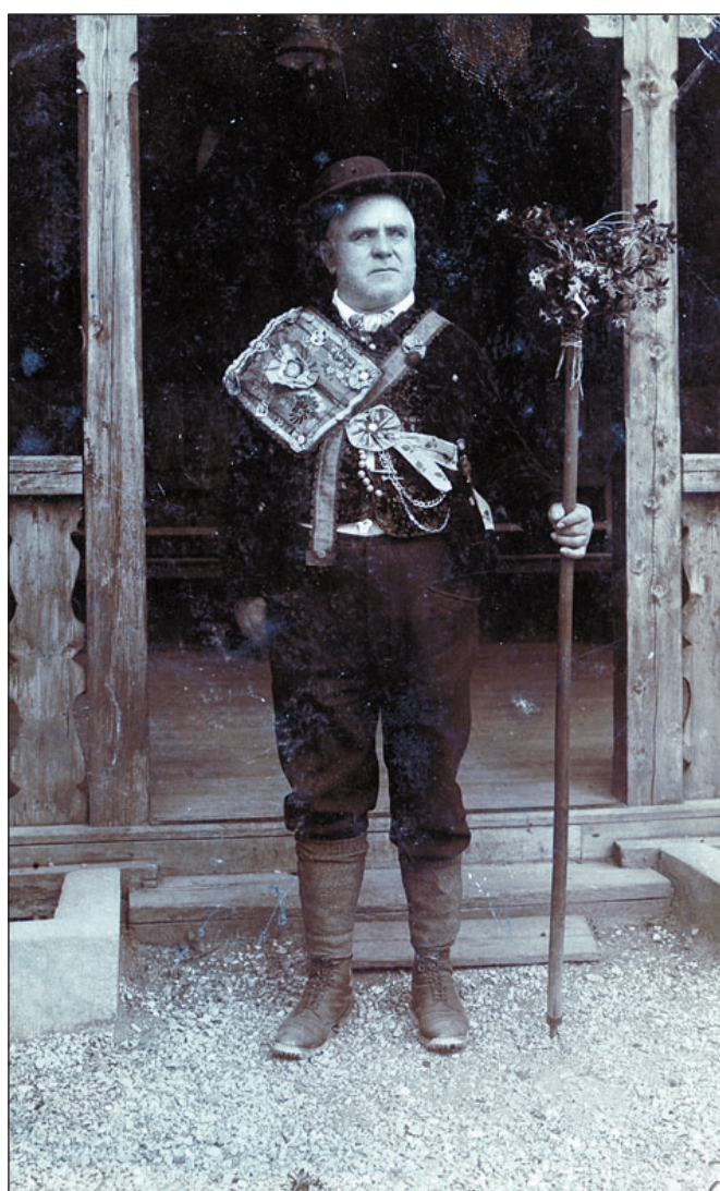
Jakob Aljaž v planinski opravi (na razglednici, poslani 1908)

"Nikakor ni lepo, če sedeš za mogočno mizo, izvlečeš iz globine nahrbtnika cele množine prekajenega mesa, pišk i.t.d. in se začneš gostiti z domačim pridelkom. Drugo jutro pa pustiš v koči za spomin par grošev za čaj in oglodane kosti."