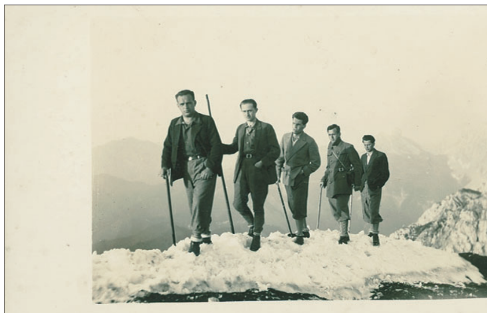
Planinci na vrhu Begunjščice (na razglednici, poslani 1930)

"Z ozirom na to, da so se tudi dame udale hribolastvu, želeč si kakor gospodje svoje zdravje izboljšati in vzdržati, dovoljujem si obenem častitim turistinjam nekaj o obleki in opravi opomniti ... Obleka bodi damam: Gladko krilo brez podloge, bluza iz fine, lahke flanele, usnjen pas ... Korset je najbolje doma pustiti, pri hoji v gore je neprijeten."